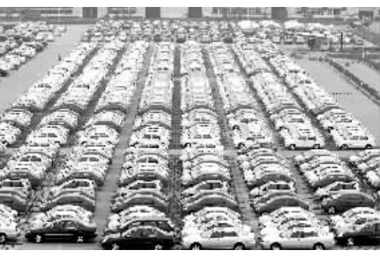
奇瑞汽车公司的停车场。

综合新华社北京5月9日电(记者张毅)据中国汽车工业协会9日发布的最新统计,今年以来我国汽车市场持续稳定增长。占我国汽车销售总量七成以上的乘用车,1-4月份共销售245.60万辆,同比增长17.84%,比上年同期增幅回落2.87个百分点。 受3月份乘用车恢复性增长涨幅过高的影响,4月份国内车市环比回落,但同比继续增长。1-4月,基本型乘用车(轿车)销售181.88万辆,同比增长18.53%,与上年同期相比增幅回落7.76个百分点;多功能乘用车(MPV)销售7.55万辆,同比增长2.47%,与上年同期相比增幅回落17.05个百分点;运动型多用途乘用车(SUV)销售14.13万辆,同比增长40.97%,与上年同期相比增幅提升15.61个百分点;交叉型乘用车销售42.04万辆,同比增长11.89%,与上年同期相比增幅提升10.33个百分点。 负责人指出,如果汽车销量全年能实现14%的增长,今年我国汽车销量将首次突破一千万辆大关。 中国汽车工业协会9日发布的最新统计显示,今年1-4月日系、中系和德系品牌在国产轿车市场占有率中,分列前三名。自主品牌轿车市场占有率较去年略有下降。 今年以来自主品牌轿车销量较快增长,但日系品牌轿车增长更快。本田、丰田、日产、马自达等日系品牌轿车市场占有率