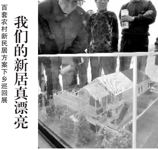
百套农村新民居方案下乡巡回展