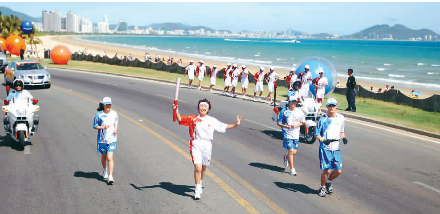
5月4日,手持奥运圣火的火炬手跑过风景如画的三亚湾。