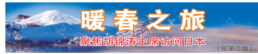
暖春之旅 聚焦胡锦涛主席访问日本 (见第二版)

中共中央书记处书记、中央办公厅主任令计划,中共中央书记处书记、中央政策研究室主任王沪宁,国务委员戴秉国等参加会见。日本国土交通大臣冬柴铁三也参加会见。