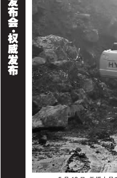
5月13日,救援人员在加紧疏通都汶公路。都汶公路是都江堰至汶川的高等级公路,受地震影响交通中断。

张晓东说:“近20年来,我们也在20几次地震之前有所察觉,有一些地震也取得了减灾实效,但这个比例很低。地震准确预告很难,我们所确定的指标,有可能在另一个地方、另一段时间就变了。”