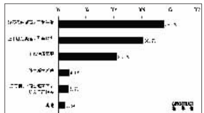
图一:车主购车主要动机