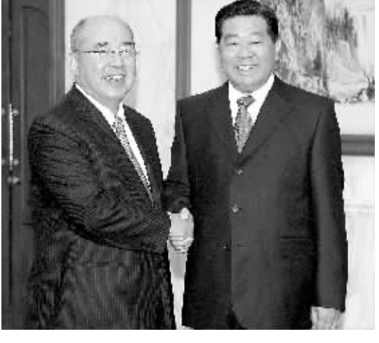
5月27日,中共中央政治局常委、全国政协主席贾庆林在北京钓鱼台国宾馆会见来访的中国国民党主席吴伯雄。