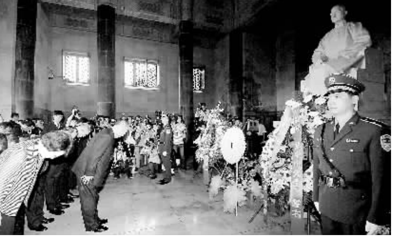
5月27日上午,中国国民党主席吴伯雄率领中国国民党大陆访问团拜谒南京中山陵。这是吴伯雄一行在南京中山陵向孙中山先生塑像鞠躬。

据新华社北京5月27日电(记者陈健兴 张勇)中国国民党主席吴伯雄27日下午率领中国国民党大陆访问团抵达北京,开始此行第二站也是最重要一站的行程。 吴伯雄在机场讲话时说,这次访问具有非常重要的意义。在两岸呈现新契机之时,我们不能浪费这一契机,而要继续努力进行良性互动。 他还表示,两个多月后北京奥运会就要举行,目前准备工作正在顺利展开。我们愿意带来台湾人民的祝福,希望北京奥运会是