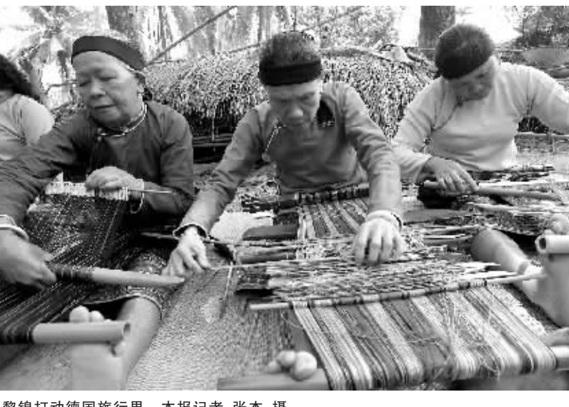
黎锦打动德国旅行社。

鹿城亟需特色旅游产品 三亚的海水、沙滩、空气质量均属世界一流,但仅凭这些自然资源,三亚旅游