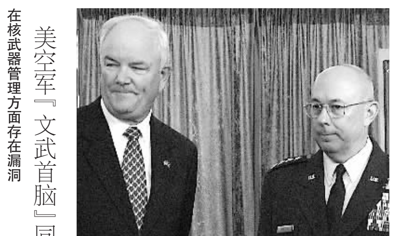
美空军「文武首脑」同遭解职 在核武器管理方面存在漏洞

新华社专电 6月5日,美国“9·11”恐怖袭击事件头号嫌疑人哈立德·谢赫·穆罕默德首次现身军事法庭,与另外4名涉案嫌疑人接受讯问。哈立德告诉法官,他愿意因策划“9·11”事件而获死刑。哈立德曾是“基地”组织3号人物。他被认为是“9·11”恐怖袭击的主要策划者,2003年在巴基斯坦被捕。 图为2003年3月1日公布的哈立德在巴基斯坦瓦尔品第被捕时的资料照片。