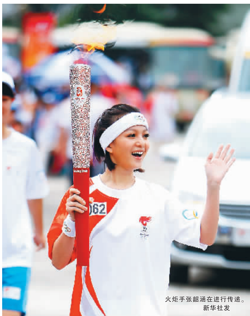
火炬手张韶涵在进行传递。