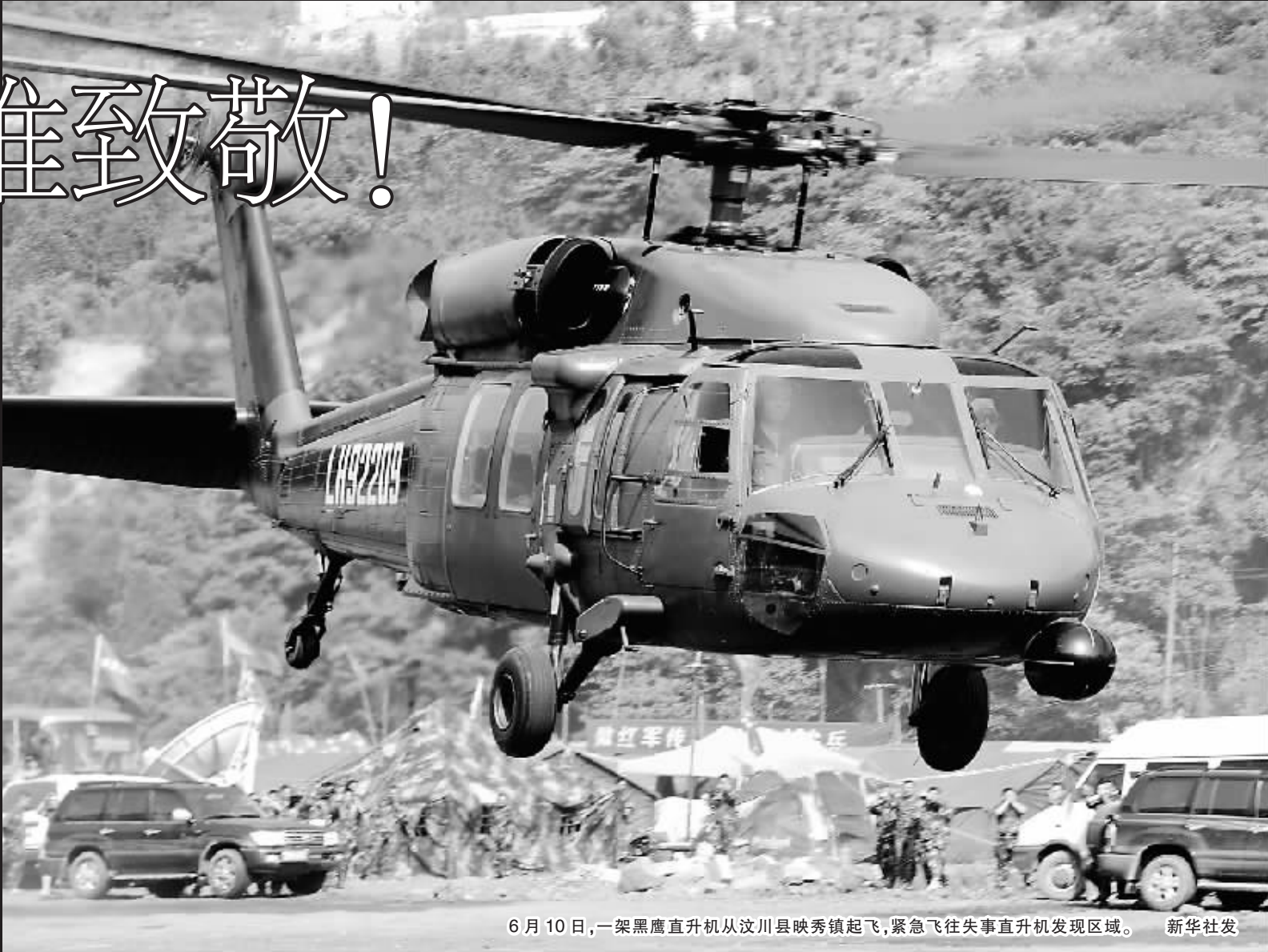
6月10日,一架黑鹰直升机从汶川县映秀镇起飞,紧急飞往失事直升机发现区域。