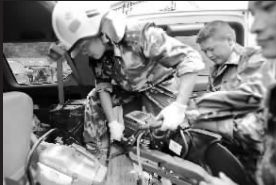
6月10日,搜救人员在四川汶川县映秀镇搬运切割设备,准备前往直升机失事地点。