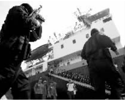
6月10日,我省首次举行船岸反恐保安联合演习。图为省港务公安局干警在演习中紧急登轮,处置事件。

蟒蛇全身都是宝,目前市场需求巨大。据粗略统计,我国仅生产二胡每年就需蟒蛇皮干不少于3万条。 如果没有规模养殖支撑市场需求,野外捕蛇行为就很难杜绝。