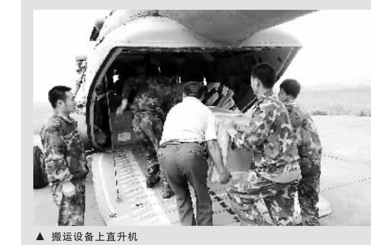
◀ 当地村民帮助突击队搬运设备