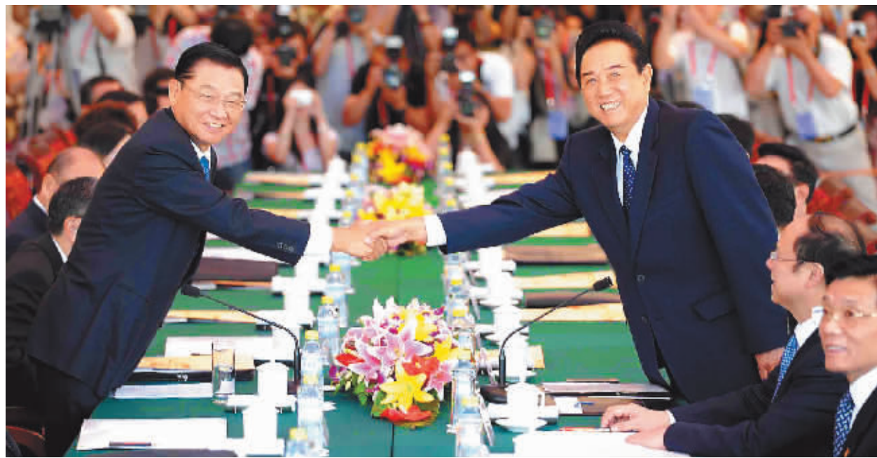
6月12日上午9时许,海峡两岸关系协会会长陈云林与海峡交流基金会董事长江丙坤会谈在北京钓鱼台国宾馆开始举行。这是时隔9年后两会领导人再度对话。

应加强两会各层级人员对话与交流,恢复指定紧急事故联系人员及联系方式,针对紧急事件或突发状况,立即相互通报。同意两会人员经常性互访,积极促成两岸业务主管部门人员以两会名义互访