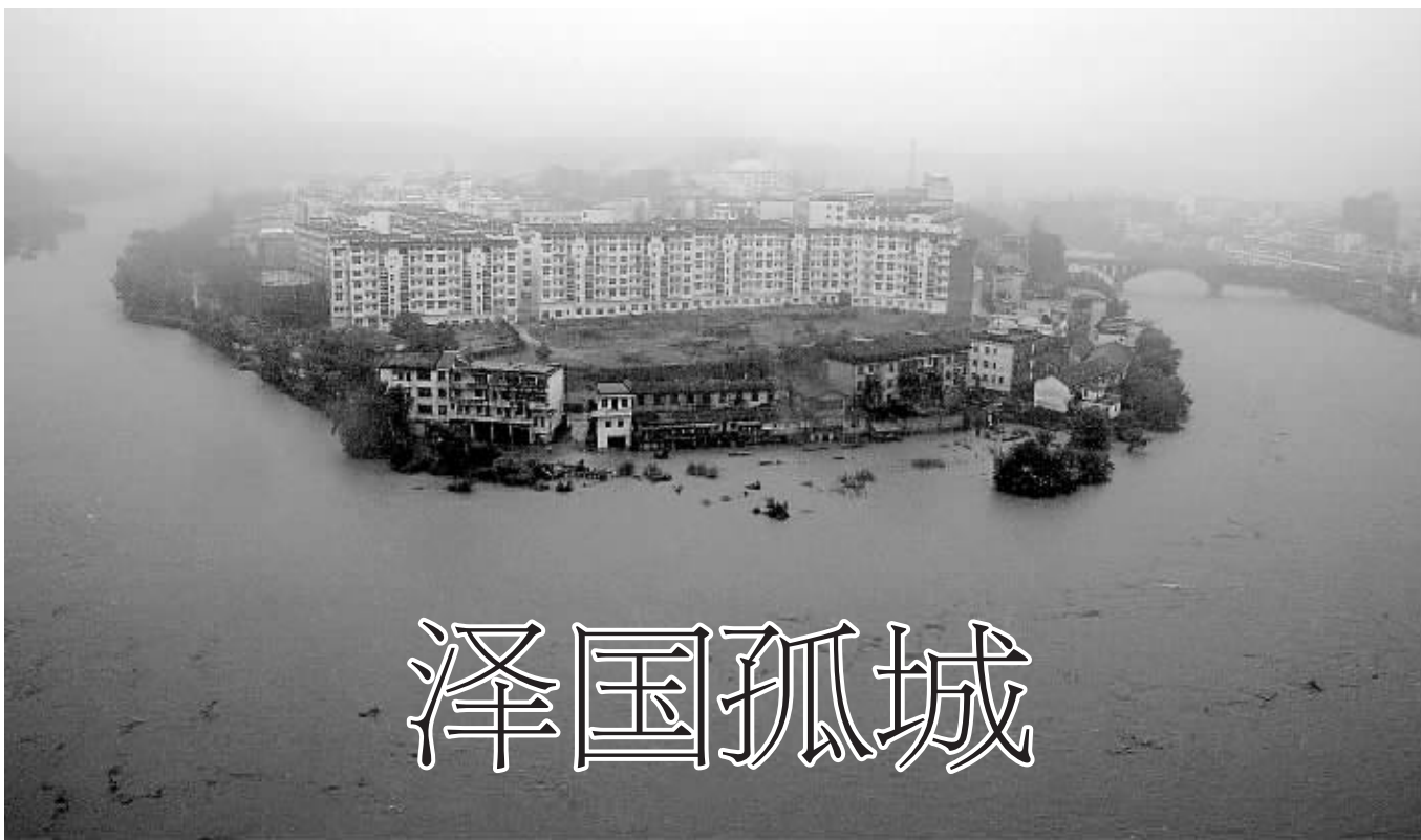
从江西婺源县城穿城而过的星江河迎来洪峰。

桂粤湘赣局地有大暴雨及强对流天气 未来10天江淮江南华南降水量偏多三至七成 (据新华社北京6月12日电)