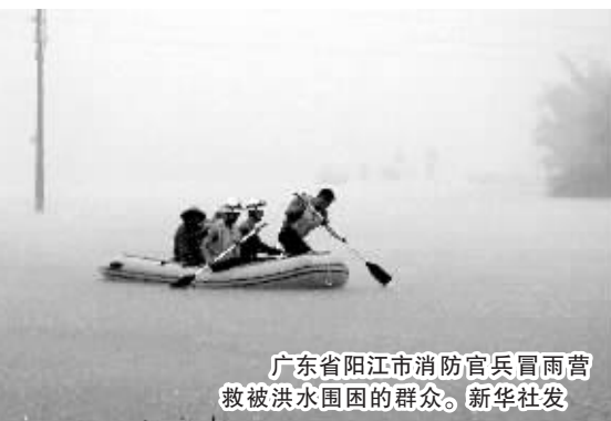
广东省阳江市消防官兵冒雨营救被洪水围困的群众。

几天来,强降雨共造成广西43个县(市、区)247个乡镇92万多人受灾,其中因灾死亡1人。已造成广西各地倒塌房屋1000余间;农作物受灾4万多公顷,公路中断149条次,损坏小型水库20座,损坏堤防192处。