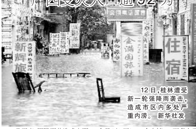
12日,桂林遭受新一轮强降雨袭击,造成市区内多处严重内涝。

几天来,强降雨共造成广西43个县(市、区)247个乡镇92万多人受灾,其中因灾死亡1人。已造成广西各地倒塌房屋1000余间;农作物受灾4万多公顷,公路中断149条次,损坏小型水库20座,损坏堤防192处。