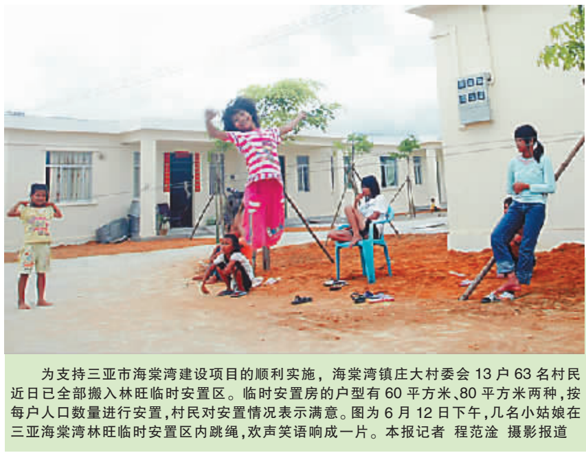
为支持三亚市海棠湾建设项目的顺利实施,海棠湾镇庄大村委会13户63名村民近日已全部搬入林旺临时安置区。临时安置房的户型有60平方米、80平方米两种,按每户人口数量进行安置,村民对安置情况表示满意。图为6月12日下午,几名小姑娘在三亚海棠湾林旺临时安置区内跳绳,欢声笑语响成一片。