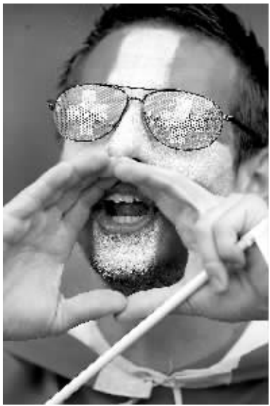
6月11日,一名瑞士球迷在等待比赛开始。