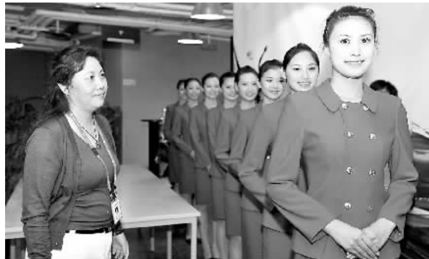
6月12日,北京奥运会颁奖礼仪专业志愿者在进行训练。据了解,北京奥运会颁奖礼仪专业志愿者招募、选拔、编队工作已全部完成。奥运会期间,将有20支颁奖礼仪团队的337人,负责奥运会302场、残奥会472场共计774场的颁奖任务。