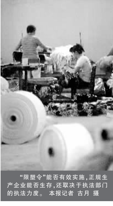
“限塑令”能否有效实施,正规生产企业能否生存,还取决于执法部门的执法力度。