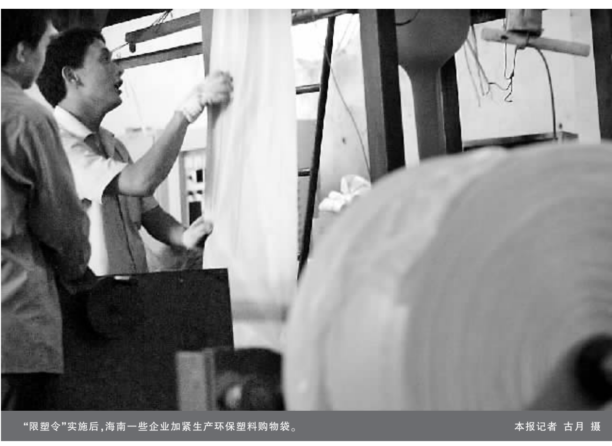
“限塑令”实施后,海南一些企业加紧生产环保塑料购物袋。

微小的变化经过不断放大,对其未来状态会造成极其巨大的影响,这就是混沌理论中的蝴蝶效应。