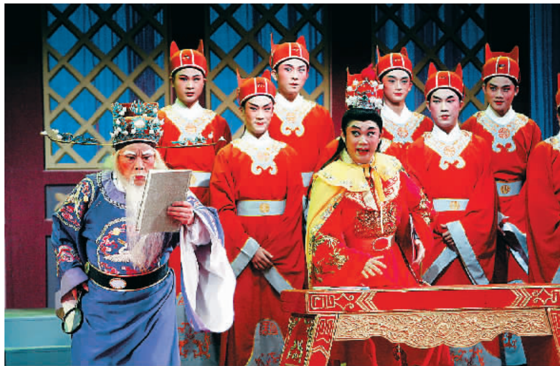
省琼剧院新编的古装琼剧《梅龙镇》演出剧照。缺乏主创人才和发展资金,是省琼剧院面临的两大问题。本报记者 陈德雄 摄