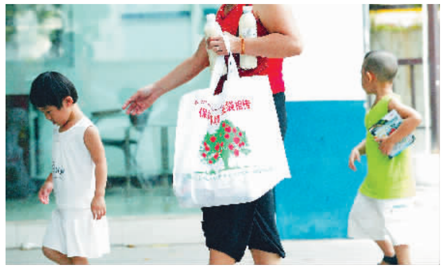
超市购物出来的人手提环保购物袋的比比皆是。

本报海口6月18日讯(记者程娟)“我买东西带环保购物袋,不要塑料袋,商家减少了成本,商家是否该给我一些特别奖励呢?”随着“限塑令”的实施,不少市民提出了这样的疑问。