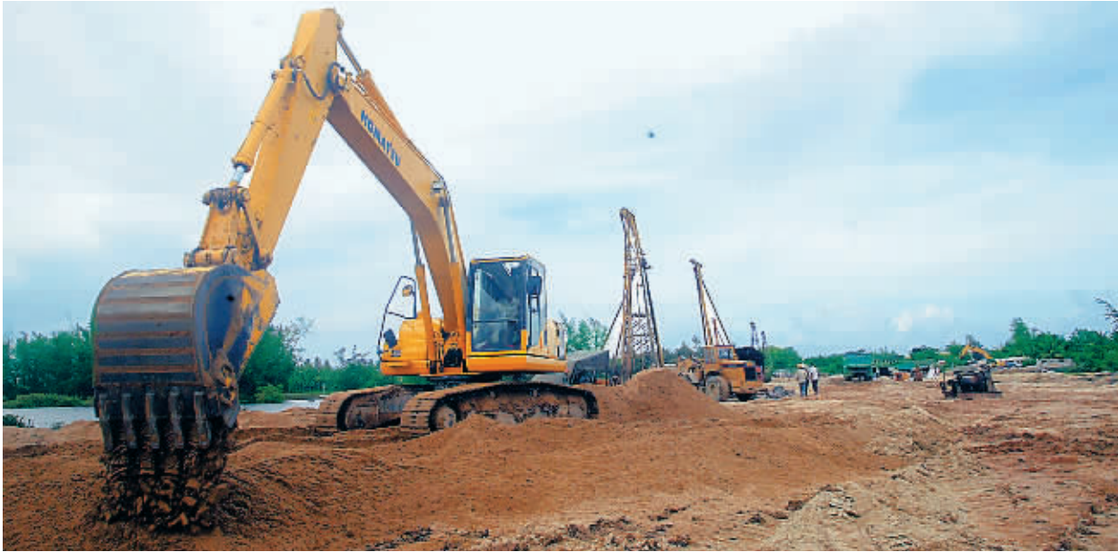
6 月 13 日,在东线高速公路海棠湾出口,海棠湾基础设施工程龙江港大桥正在紧张施工。