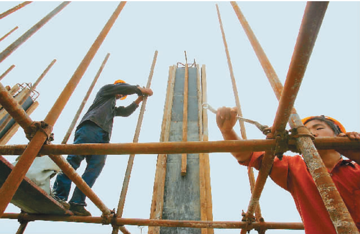
洋浦保税港区建设创造海南速度。

本报洋浦6月22日电(记者官蕾 张中宝 李关平)“尽管受到天气和原材料等因素影响,但工程仍按既定目标全力推进。”20日上午,海南洋浦开发建设控股有限公司工程事业部总经理姚云亭站在保税港区一期卡口前对记者说这话时,天上下着细雨,工地一片火热。