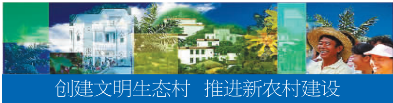
创建文明生态村 推进新农村建设