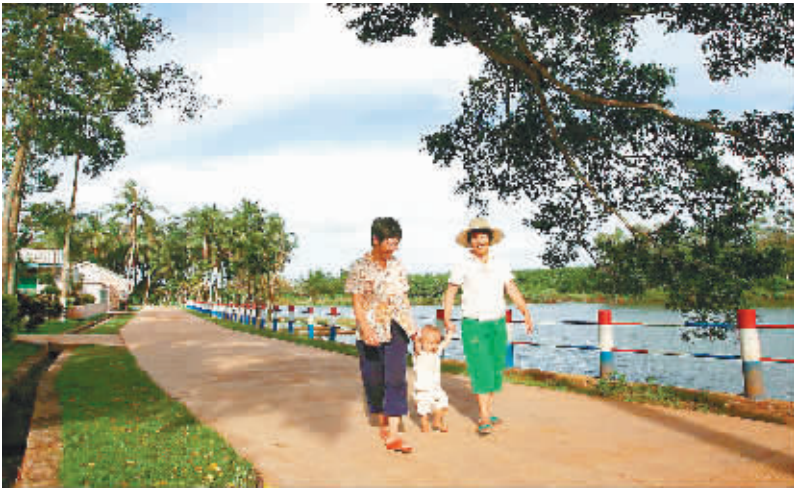
龙连村里处处是美景。

形成了“村村争创建、人人争参与”的良好局面。创建资金已由过去由政府投入为主发展到了现在以农民群众自筹为主。