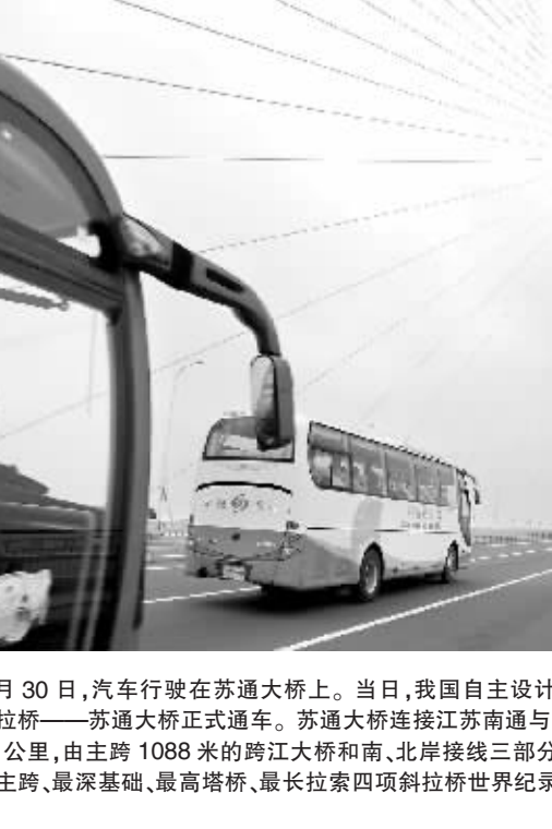
6月30日，汽车行驶在苏通大桥上。当日，我国自主设计建设的世界最大跨径斜拉桥——苏通大桥正式通车。苏通大桥连接江苏南通与苏州两市，路线全长32.4公里，由主跨1088米的跨江大桥和南、北岸接线三部分组成。该桥创造了最大主跨、最深基础、最高塔桥、最长拉索四项斜拉桥世界纪录。