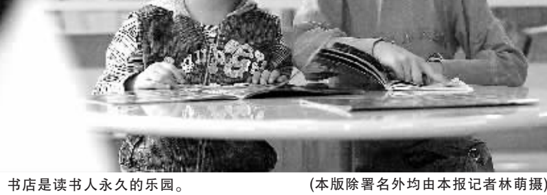
书店是读书人永久的乐园。

卡尔不是唯一一个遇到此种问题的人。长期在密歇根医学院任教的布鲁斯·弗里德曼,今年早些时候也在自己的blog(博客)上写到互联网如何改变了他的思维习惯。“现在我已几乎完全丧失了阅读稍长些文章的能力,不管是在网上,还是在纸上。”他在电话里告诉卡尔,他的思维呈现出一种“碎读”特性,源自上网快速浏览多方短文的习惯。“我再也读不了《战争与和平》了。”弗里德曼承认,“我失去了这个本事。即便是一篇blog,哪怕超过了三四段,也难以下咽。我瞅一眼就跑。” 伦敦大学学院以5年时间做了一个网络研读习惯的研究。学者们以两个学术网站为对象——它们均提供电子期刊、电子书及其他文字信息的在线阅读,分析它们的浏览记录,结果发现,读者总是忙于—