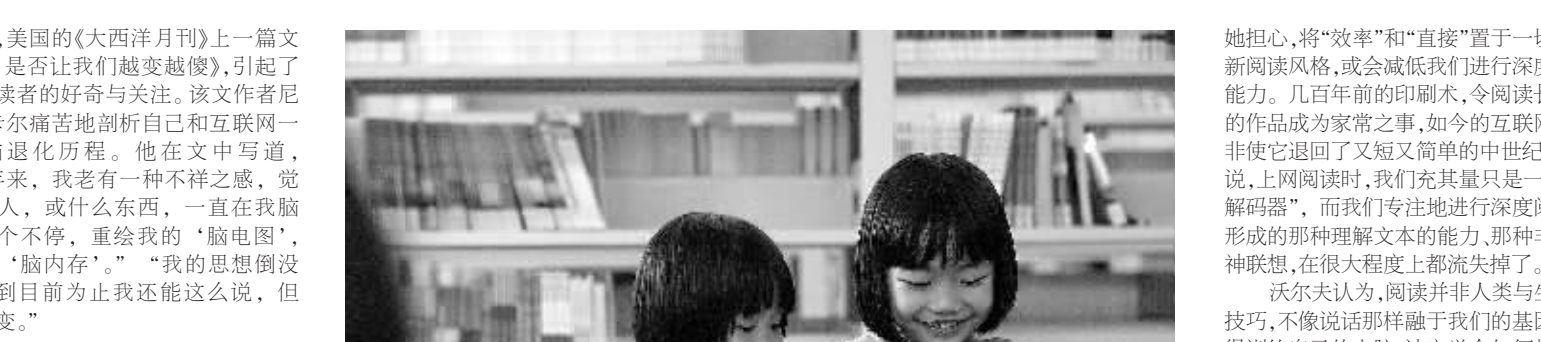
书店是读书人永久的乐园。(本版除署名外均由本报记者林荫摄)