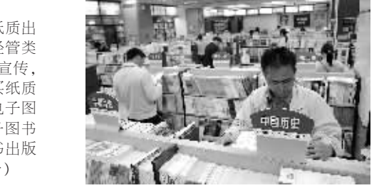
书店是读书人永久的乐园。