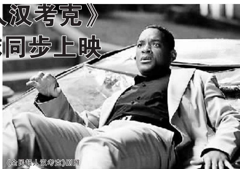
《全民超人汉考克》剧照

据介绍,《全民超人汉考克》由好莱坞票房皇帝威尔·史密斯携手奥斯卡影后查理兹·塞隆联合主演,威尔·史密斯最近7部影片票房全部过亿美元,其中包括征战春季档的《全民情敌》、征战暑期档的《我,机器人》和《绝地战警2》、征战秋冬档的《鲨鱼故事》、征战圣诞档的《当幸福来敲门》和《我是传奇》等,都无往而不胜。而大美女查理兹·塞隆也不是花瓶,她2004年凭借电影《女魔头》中的出色演技,一路斩获美国电影金球奖影后、柏林电影节影后和奥斯卡影后三项桂冠,两人的联手,使《全民超人汉考克》具备相当的关注度。