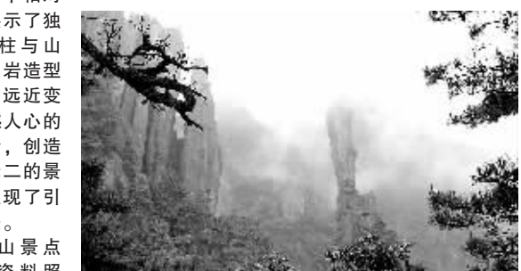
“雪龙”号全貌。

据悉,第三次北极科考是我国北极科考史上规模最大、耗资最多的一次,此次科考将以“北极快速变化及其对我国气候与环境的影响”为核心,主要针对北极海冰气系统的耦合变化、北冰洋独特的生物资源和基因资源、北极地质和地球物理等开展研究。