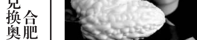
本月初,一位“故宫晶华”餐饮中心的员工在展示采用苹果苦瓜为原料制作的类似清代藏品白玉锦荔枝的菜肴——“白玉锦荔枝”。

位于台北故宫博物院院内、由晶华国际酒店集团经营管理的“故宫晶华”餐饮中心在今年6月正式推出“故宫国宝宴”,该餐饮中心的厨师们精心制作出与台北故宫博物院珍藏品紧密结合的九道精美菜肴,包括“翠玉白菜”“肉石”“白玉锦荔枝”等,希望消费者在参观完台北故宫博物院后,能在此餐厅品尝这些堪称艺术品的菜肴,展现中华美食的博大精深。