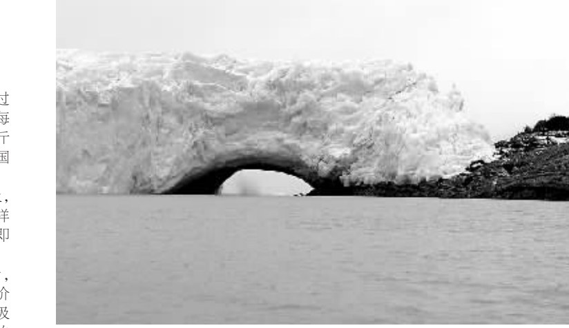
7月7日,位于阿根廷南方加拉法特的国家冰川公园内的莫雷诺大冰川开始崩塌,目前冰川已经被冲出一个大洞,形成独特的冰川拱门的景观。整座冰川拱门最终将彻底坍塌。