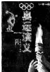
作者:季一德 上海人民出版社

由上海人民出版社出版的《奥运演义》可以当成一本史书来读，它所撰写的奥运会恢恢的历史可以和中国古典小说《三国演义》相媲美。该书采用中国古典小说所惯用的章回体例，从奥运会的起源娓娓道来。搜集的史料极为详实，从赛事经典到逸闻趣事，从光辉人物到丑陋事件，无所不有，简直就是历届奥运会的“万花筒”。该书也并非一味求新求奇，在阐述奥林匹克精神方面同样不惜笔墨，但却不是板着脸引经据典，而是以粗浅的叙事取而代之，勾勒出历届夏季奥运会的风情和风貌。