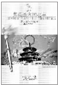
中国轻工业出版社 文明杂志社 编

在众多奥运图书中，图文类比较抢眼，其中《奥运圣火照北京》一书最为系统和完整。《奥运圣火照北京》是一本全面介绍百年奥运火炬传递历史的中英双语珍藏画册，是“人文奥运”的重要组成部分，共刊登珍贵照片近400幅，是迄今关于奥运火炬传递最完整的记录。画册由五部分组成，其中第五部分《2008，遥望圣火》，展望2008年北京奥运圣火传递的盛况，展示博大精深的中华文化。