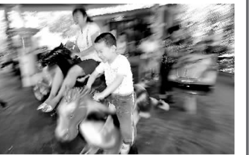
7月12日,一个男孩在银川市中山公园乘坐旋转木马。暑假来临,孩子们纷纷来到公园游玩,享受快乐暑期生活。

对于火爆的暑期“衔接班”办学,济南市教育局工作人员接受采访时指出,办学机构必须到教育部门申请,得到批准后才能招生。然而,很多所谓的“衔接班”并未经过教育主管部门批准,属违规办学。