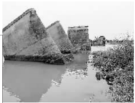
部分专家建议,将这段倒塌的只剩桥墩的部分拆除。