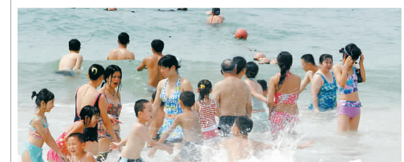
随着暑期的到来，三亚迎来了“家庭游”热潮。图为7月13日上午，人潮涌动的大东海景区。

“清凉一夏 三亚度假”系列促销活动也取得成效，来自湖南、浙江等地的游客量明显提升，到大海里游泳消暑、在清风中赏椰纳凉成为游客的最爱。