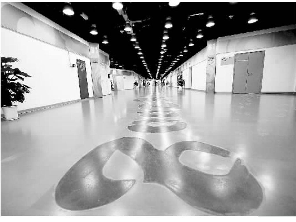
7月14日,北京奥运会残奥会新闻中心(MPC)的通道地面上写有“北京2008”的字样。北京奥运会残奥会新闻中心于日前正式启用,以其充满中国特色的面貌迎接各国媒体的检阅。