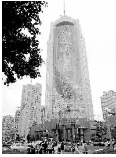
近日,一幅墙体贴膜奥运宣传画亮相青岛。这幅贴在50层楼上的宣传画高近150米、宽40米,面积约6000平方米。 新华社发

这三名西班牙男子将在奥运会比赛结束前数天抵达北京,他们此行的最大目的是观看世界冠军获得者、西班牙铁人三项选手哈维尔的比赛。