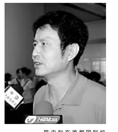
陈忠和在首都国际机场接受媒体采访。

本报北京7月14日中午11点50分,结束大奖赛总决赛征程的中国女排乘坐CA422次航班从日本回到北京。大约经过50分钟办完提取行李等手续后,队伍于12点45分左右出现在接机记者面前。