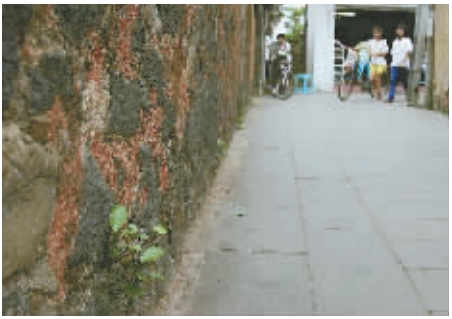
海口府城古道——达士巷。