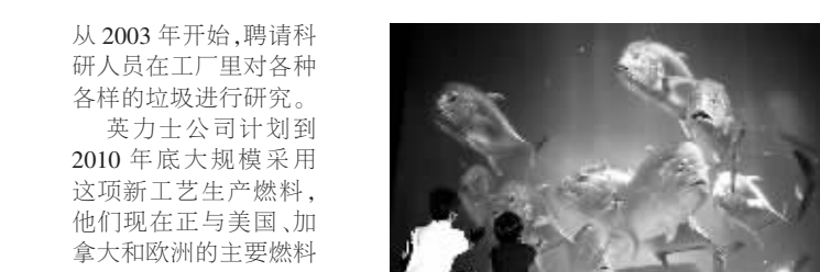
以假乱真 7月21日,在位于日本东京的索尼公司展示厅,孩子们伸手触摸索尼4K SRX超高分辨率投影机投射的冲绳水族馆的影像。该款数字投影机的画面清晰度可达4096x2160像素。

同时,垃圾变燃料也为有车一族带来福音。去年英国柴油价格涨到平均每升1.33英镑(约合2.66美元),大规模采用垃圾变燃料生产工艺后,油价有望下降。 不仅如此,这个工艺还有助于减少温室气体的排放。威廉斯说:“乙醇燃烧释放的温室气体比汽油少,甚至可以减少90%,所以说我们的新生产工艺将会为全球减排作出更大贡献。” 公司发展 英力士公司在大约20年前开始垃圾变燃料的研究。他们率先建立一家工厂,从2003年开始,聘请科研人员在工厂里对各种各样的垃圾进行研究。 英力士公司计划到2010年底大规模采用这项新工艺生产燃料,他们现在正与美国、加拿大和欧洲的主要燃料消费厂家商谈销售事宜。威廉斯希望,将来在北美和欧洲,乙醇至少可以取代10%的汽油使用量。 “我们计划在2年内生产出更多的车用乙醇,最终把这个生产工艺推广到全球。”威廉斯说。不过,英力士公司对第一处用垃圾生产商用乙醇的工厂厂址暂时保密。 英国非粮食作物研究中心的负责人杰兰特·埃万斯说:“这个新生产工艺在两个领域有突破性进展。从技术层面上说,我们可以利用固体垃圾。从商业层面上说,乙醇的潜在商机很大。” 佟宏玲 (新华社供本报特稿)