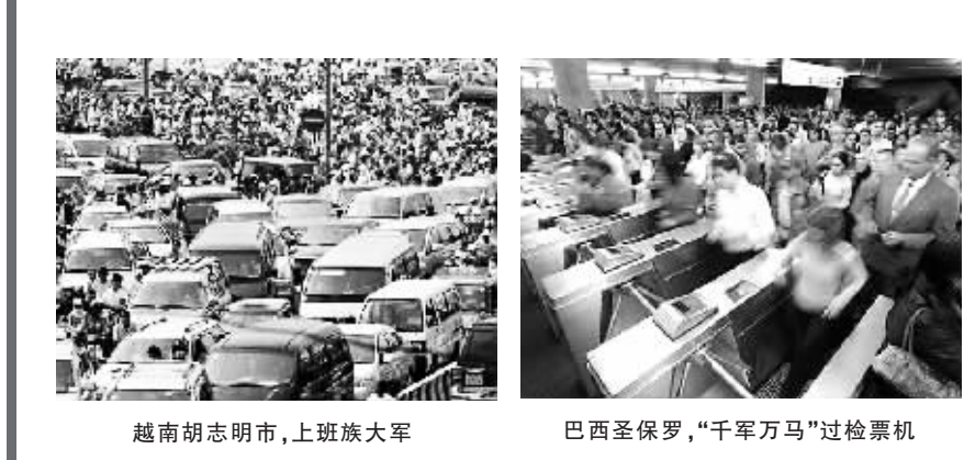
越南胡志明市,上班族大军 巴西圣保罗,“千军万马”过检票机