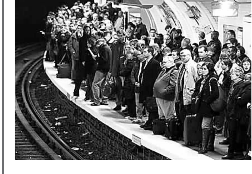
法国巴黎,等车的人们 澳大利亚悉尼,早高峰大堵车