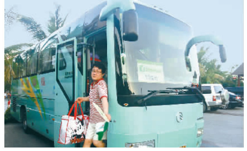
7月22日,三亚又迎来一韩国旅行团。据导游介绍,这批韩国游客有500多名,拟在三亚停留4天,将慕名到南山、大东海等景区参观休闲。

12个月内未发生保护风景旅游资源不力、未出现资源严重毁损事件并在全国造成重大影响;未发生主要领导严重违法违纪、违法犯罪活动;未发生重大安全责任事故、重大刑事案件;未发生有全国影响的重大服务质量投诉事件。 标准内容包括“思想道德建设”、“管理监督机制”、“文明服务质量”、“环境与资源保护”、“安全保障体系”、“文明创建措施”6个方面、20项检查项目。检查主要采取听取汇报、文档审核、实地考察、个别访谈和问卷调查等方式,部分测评要点采用明查与暗访相结合的方式。 据了解,南山开园10年来,一直积极打造文明、生态的旅游环境。2002年,中央文明办、建设部、国家旅游局授予南山景区为“全国文明风景旅游区示范点”。2006年,三部门又授予南山为“全国创建文明风景旅游区工作先进单位”。今年8月,中央文明办、住房和城乡建设部、国家旅游局等部门将联合对南山景区进行综合评审。