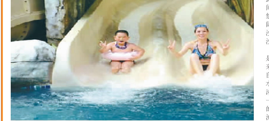
在亚龙湾戏水应是最快乐的事了。

便和劳累,改成家庭型的自由度假游。入住亚龙湾的天域度假酒店,沙滩、美食、阳光、休闲这一切一切度假的元素都囊括其中,你可足不出户一享受。开放式的长廊外是露天的泳池及由几十位园林工人精心维护的宽阔草坪,迂回曲折的构造一改以往酒店泳池的单调和直板。大人小孩分区错落有致尽显人性化设计,清澈的池水倒映着茂密的椰树及诸多叫不上名的阔叶植被,让人有仿佛入画之感。 酒店有专属的私家海滩,在这里你永远不用担心无聊落寞会前来扰乱心绪,沙滩排球、潜水、游泳、快艇、摩托艇、钓鱼、拖曳伞、上天入海,每一项都足以让你激发出无限激情。玩累了就在仿原始草棚下的躺椅上休息一会儿,静看欣