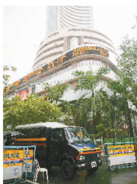
7月27日,一辆警车驶出已被警方封锁的孟买证券交易所大楼。由于连环爆炸,使得印度各主要城市进入高度戒备状态,以防遭到恐怖袭击。

要机构奉命加强安全措施。” “印度圣战者”宣称负责 一个自称为“印度圣战者”的组织当天宣称,对艾哈迈达巴德市连环爆炸案负责。 在当天向印度一些电视台发去的电子邮件中,“印度圣战者”宣称发动了攻击。邮件说:“等5分钟,古吉拉特事件的报复就要来临。” 一些分析师说,邮件中的古吉拉特事件是指2002年发生在古吉拉特邦的宗教流血冲突。 2002年2月27日,一列满载印度教教徒的火车遭袭并遭到焚烧,造成约60人丧生。惨案引发大规模流血冲突,导致1000多人丧生,其中多为伊斯兰教教徒。 邮件没有提及南部城市班加罗尔的爆炸事件。