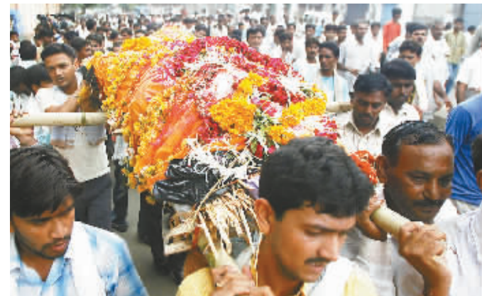
七月二十七日,印度民众为一名连环爆炸事件遇难者举行葬礼。

素有“印度硅谷”之称的班加罗尔25日发生连环爆炸,造成至少1人丧生,6人受伤。印度内政部认为,这两起连环爆炸作案手法相似,可能是同一组织所为。 “印度圣战者”5月宣称,对当月发生在印度西部拉贾斯坦邦斋浦尔市的连环爆炸案负责。共有61人在那次爆炸案中死亡。这是“印度圣战者”首次进入人们视野。 一些分析师认为,一些恐怖组织试图通过袭击,挑拨伊斯兰教和印度教两大宗教之间冲突。 据《世界知识年鉴》,印度境内约82%的居民信奉印度教,12%的人信奉伊斯兰教。 韩建军(新华社供本报特稿)