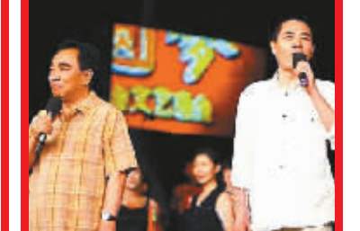
本文配图均为《百年圆梦》排练现场

新华社北京7月28日电(记者廖湖)由中宣部、国家广电总局、国家体育总局、北京市委、北京奥组委联合主办的“百年圆梦——迎2008北京奥运会文艺晚会”,29日20时将在中央电视台一套、三套、四套并机直播。记者从央视晚会组获悉,这于北京奥运会倒计时10天登场的大型主题晚会,将由歌舞、戏曲、朗诵、杂技等文艺表演穿插人物访谈、奥运宣传短片等方式进行。观众熟悉和喜爱的歌唱演员宋祖英、刘斌、韦唯、毛阿敏、腾格尔、刘欢、谭晶、孙悦、韩红、朱哲琴、斯琴格日乐等将在晚会上演唱《北京欢迎你》《同一个世界,同一个梦想》《站起来》《超越》《奥林匹克颂》等奥运歌曲。人物访谈部分十分精彩,都是与奥运有着紧密关联的代表性人物。奥运宣传短片则由《天津——北京》《中国表情》《故宫——鸟巢》《五环表情》《奥林匹克山——珠穆朗玛峰》等组成,其中《故宫——鸟巢》以北京中轴线上的故宫、鸟巢、奥林匹克公园三个城市地标体现新奥运的三大理念,《奥林匹克山——珠穆朗玛峰》展示孕育于古希腊的西方文明和传承五千年东方文明的融合,让观众在感动中获得思想共鸣。据介绍,周华健、成龙、容祖儿、莫华伦等港澳演员及部分外籍演员也将参加晚会演出。