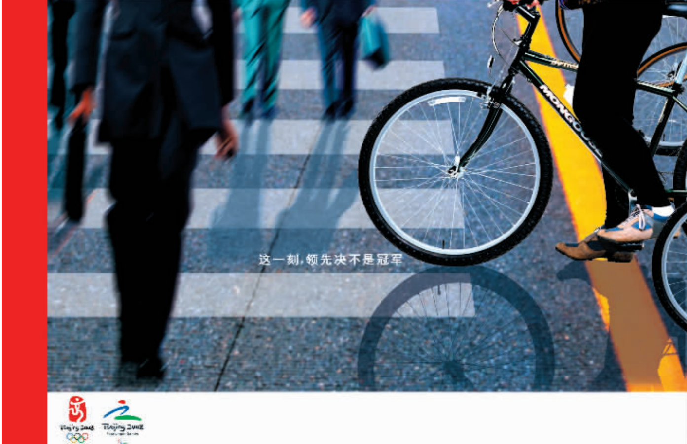
这一刻,领先决不是冠军

空姐招募评委高凌风透露 太太也是空姐 7月26日、27日,江苏卫视首创上电视直播的“南航空姐招募大汇”,已经进行到了第五场、第六场决赛,吸引了越来越多观众和向往空姐职业的粉丝关注的目光。赛后,记者采访“麻辣”评委高凌风时获悉,他现在的太太,正是一位他“骗”回家的空姐。高凌风透露说,他真的对空姐这份职业有着特殊的感情。因为,他现在的太太就曾经是一位空姐。高凌风说,别看他现在在电视上嬉笑怒骂,好像非常风光,然而,他的家庭生活却有着难以言说的过去。他说,在走过两次失败的婚姻之后,如今是第三次步入婚姻殿堂了,他高凌风已经变成了一个“疼老婆、爱孩子的好老公、好爸爸”。高凌风神秘地告诉记者,他现在的这位妻子,当年就正是一位空姐。“我们相识就是在飞机上,她的气质让我一见钟情,而她对生活的热爱,让我从一个不归家的流浪者,转变成了如今的居家男。追求她的过程,对我来说比以往任何一次恋爱都来得困难。我知道,我是用‘骗’才赢得这个老婆的,也是用‘骗’才‘抢’来了这段幸福的婚姻。总之,对于这份来之不易的感情,