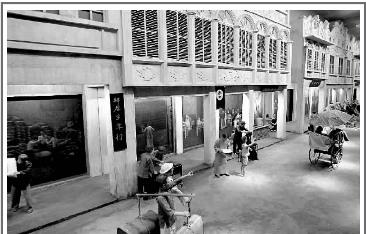
↑ 馆内搭建的骑楼景观。

海口南北通货运市场是目前海南省规模最大、服务功能最齐全的大型货运市场。它是海南省公路货运物流龙头企业,也是省内外各类物资调运车辆在海南最大的集结地。