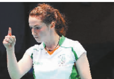
爱尔兰选手克洛艾·诺埃尔·马吉失误后。