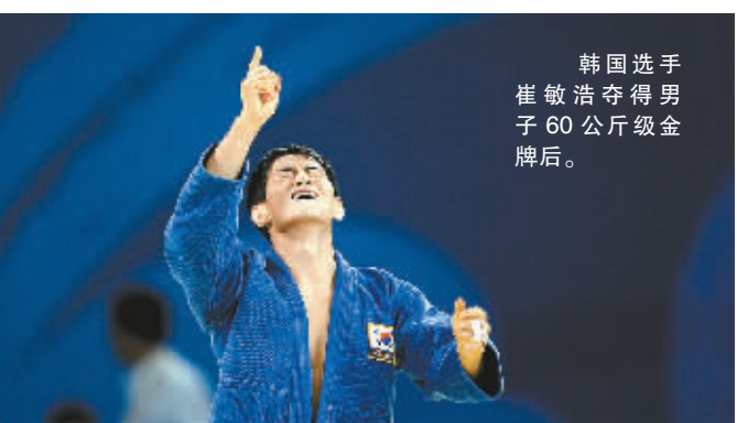
韩国选手崔敏浩夺得男子60公斤级金牌后。