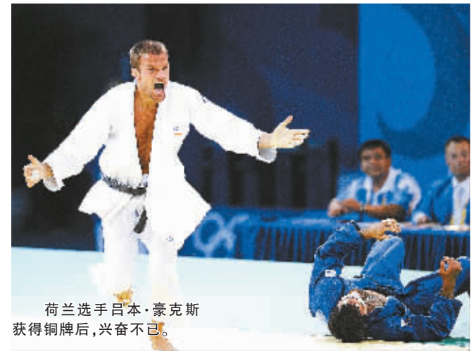
荷兰选手吕本·豪克斯获得铜牌后，兴奋不已。