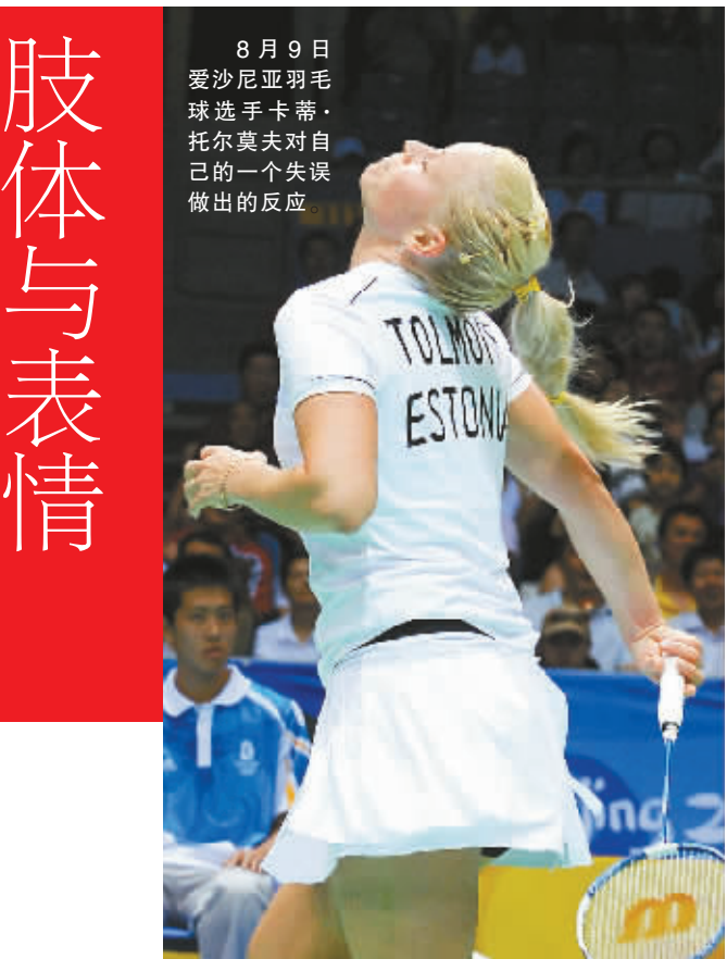
8月9日爱沙尼亚羽毛球选手卡蒂·托尔莫夫对自己的一个失误做出的反应