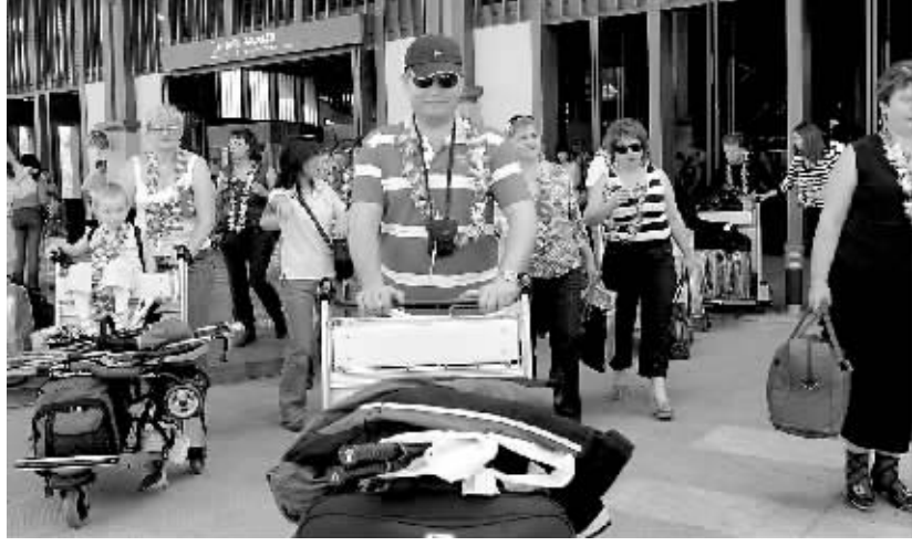
2007年11月7日上午, 西伯利亚首航三亚的包机带着227名俄罗斯游客飞抵三亚。(资料照片)

坐飞机到三亚看海是很多人理想中的旅游度假方式。近几年, 除了正常的旅游包机和航班外, 国内外一些大公司、大企业负责人和各界名人乘坐度假专机飞来三亚度假的现象与日俱增, 不仅掀起了一股高端度假潮, 也为三亚带来了更多发展机遇。