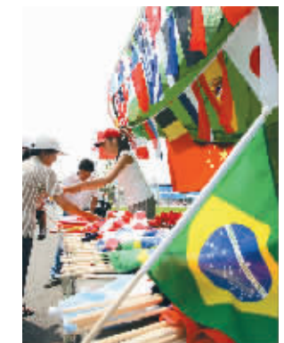
各国国旗好一个热销!

2008年8月12日,在北京朝阳公园沙滩排球比赛场馆外面,各国国旗热销。随着奥运比赛进程的推进,各国国旗深受各国啦啦队的欢迎。