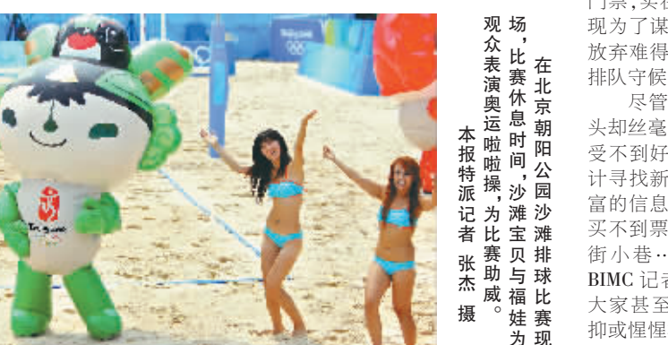
观众表演奥运啦啦操为比赛助威助威。

本报北京8月15日电(特派记者 张杰)“总算买到了票!我可不是从昨晚7点就守在这里排队了,一宿没睡啊”这名记者买到票后,脸上熬夜排队的疲倦似乎一扫而光。在周围其他同样羡慕的眼光中,他满载而归。而记者身旁的一位来自南京现代快报的同行还在发愁:“我早上5点多来排队的,拿到的是第26号,不知道还有没有戏。”听到他这话,那些排到100多号的同行更是面露担忧。这一幕就发生在2008年北京国际新闻中心的门票服务办公室过道里。