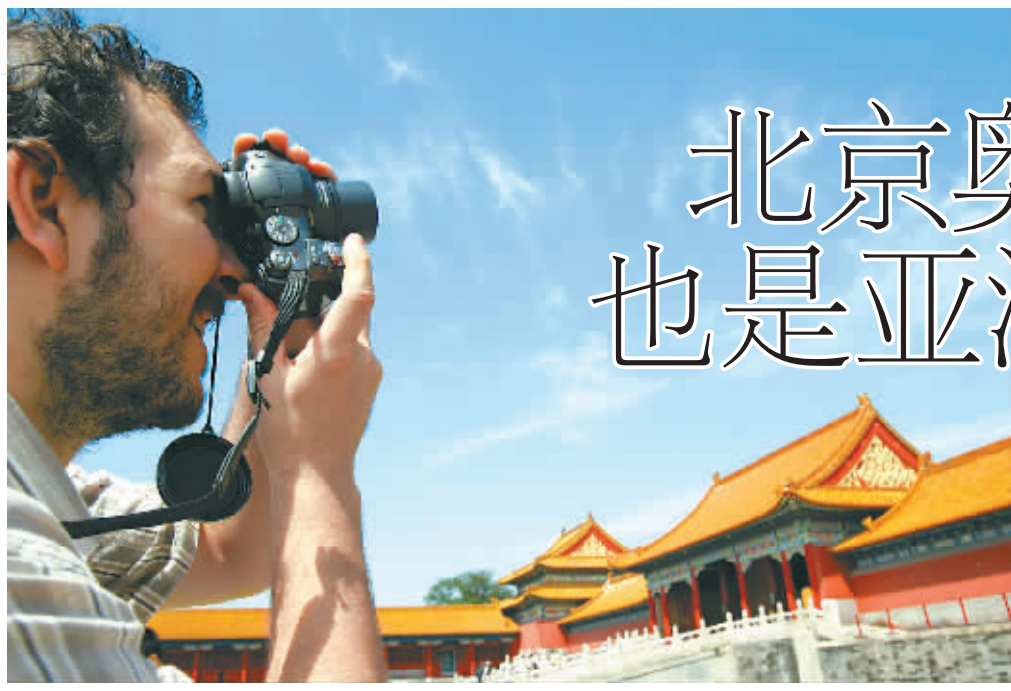
8月15日,北京迎来奥运开幕以来第一个蓝天,趁着今天没有观看的比赛项目,来自美国的奥运会观众专门来到故宫参观,了解中国传统文化。