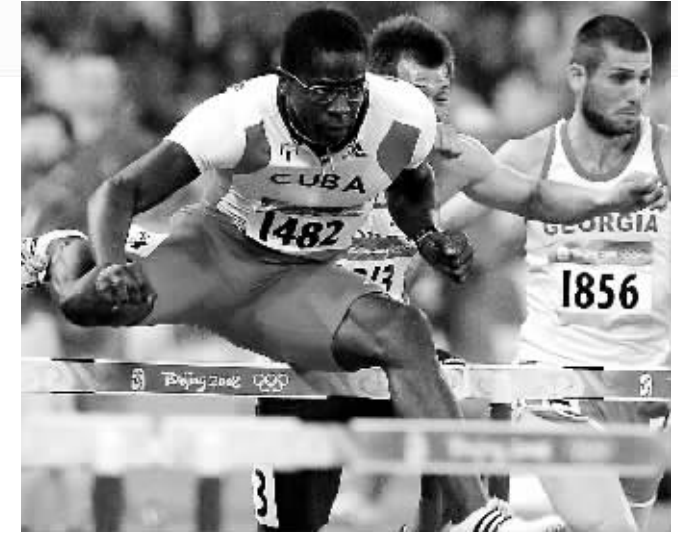
8月19日，古巴选手罗伯斯(左)在男子110米栏第二轮比赛中以小组第一名的成绩晋级。