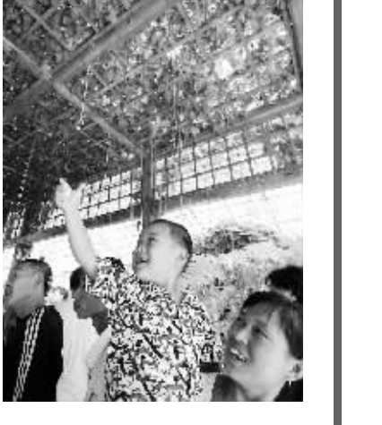
第八怪 活的门帘用手拽(观赏植物——锦平藤)

100名高校教师 获教学名师奖 据新华社北京8月28日电 教育部28日公布,经过地方推荐、同行专家网络评审和会议评审,北京大学温儒敏等100名高校教师获得第四届高等学校教学名师奖。据介绍,此次评选由教育部、财政部联合开展。获奖教师有长期从事本科教学工作,具有较高学术造诣,注重教学改革与实践,教学水平高,教学效果好的高等学校教授,也有在高等职业教育中坚持教育教学改革,在工学结合、产学研合作方面发挥重要带头作用的高素质“双师型”专业教师,他们都是全国高等学校教师中的杰出代表。