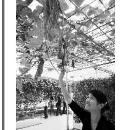
第三怪 红薯长在泥土外