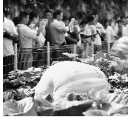
第六怪 千斤南瓜满园晒