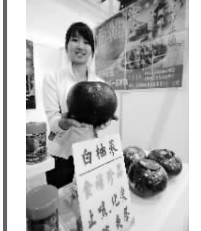
第四怪 茶用柚子包起来