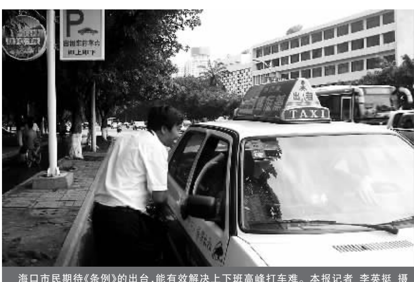
海口市民期待《条例》的出台,能有效解决上下班高峰打车难。

根据委员们的建议,《条例》对出租汽车经营权招投标的方式程序等都作了进一步规范,其中明确规定经营者在竞标前2年内发生过两次以上重大或者重大交通事故,或者有两次以上限期整改记录的,禁止参加新一轮出租车经营权竞标。