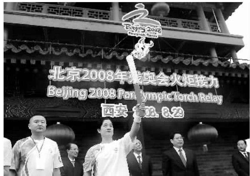
北京2008年残奥会火炬接力 Beijing 2008 Paralympic Torch Relay 西安 08. 8. 29