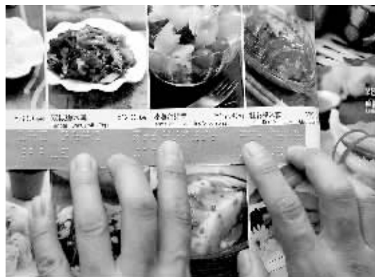
京城餐馆推出盲文菜单 9月2日,北京平乐园一家川菜馆推出盲文菜单。