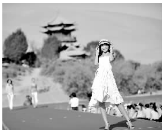
月牙泉边模特赛 9月3日,敦煌国际服饰模特大赛总决赛在敦煌鸣沙山——月牙泉景区举行。

据新华社上海9月3日专电 (记者王蔚)3日10时40分,又有7名滞留泰国普吉岛的上海游客回到浦东国际机场。至此,赴泰游平安返回的上海游客已超过200名。