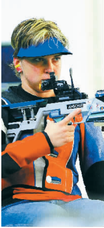
北京残奥会首金得主斯洛伐克选手韦罗尼卡·瓦多维乔娃在比赛中。