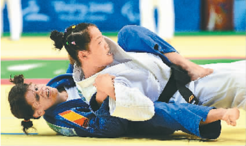
女子柔道48公斤级金牌得主中国选手郭华平(上)在比赛中。