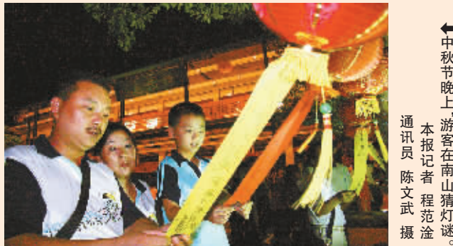
←中秋节的晚上,游客在南山猜灯谜。