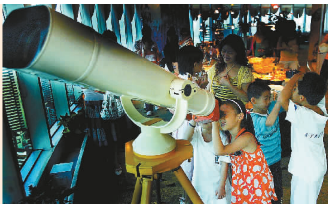
↑海口市青少年天文兴趣小组的孩子们,通过设在黄金大酒店31层的天文望远镜观看月亮。