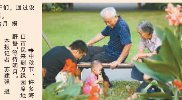
→中秋节,许多海口市民来到万绿园席地野餐,等待明月。