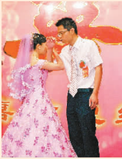
↑海口许多新人纷纷选择中秋节举行婚礼,祈求“花好月圆”。