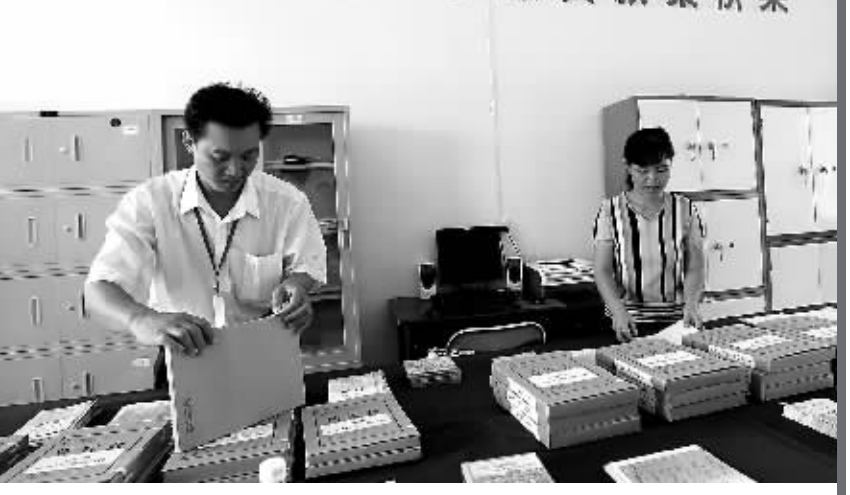
9月1日,琼中营根镇农村小额贷款服务站内,工作人员正在整理农户贷款档案。

什么样的信息会被“记录在案”呢?银行人士说,主要是您的基本信息,然后是整体负债情况,包括您在哪家银行贷了多少款,办了几张信用卡,是否按时、足额地还了款,包括各类贷款、信用卡,以及各类先消费后付款的公用事业费用等,还有为他人贷款担保的信息。另外,个人信用数据库还可能记录个人纳税、参加社会保险等信息。