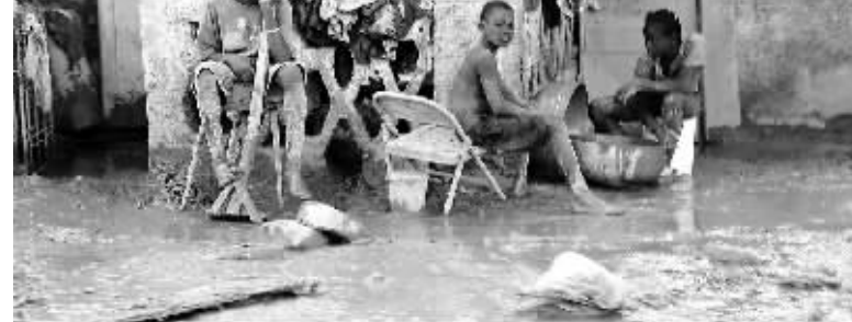
9月22日,海地戈纳伊夫镇的居民清理洪水退去后留在门前的泥浆。