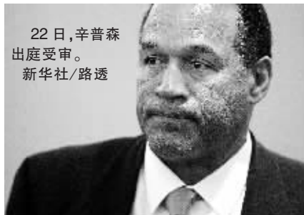
22日,辛普森出庭受审。

美国前橄榄球明星O.J.辛普森涉嫌持枪劫案22日再起波澜。2名证人当天出庭作证时就辛普森是否知道案发过程中有枪一事意见相左。