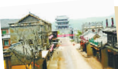
赵本山名下的影视城

据广州日报报道,9月6日,赵本山大女儿赵玉芳出嫁时,赵本山一把就奉上300万陪嫁礼,除此之外,还有送给女儿的房、车等实物,这激起了大众对赵本山个人身家的好奇。原来,赵本山不仅是小品大师,更是成功商人,仅其名下的影视城,便市值7亿元。《福布斯》杂志公布赵本山年收入1300万元时,曾有记者与赵本山交流,他笑说:“我就能赚这点钱吗?”随后,他又补充道:“说实话,我究竟有多少钱,我自己也不知道。”