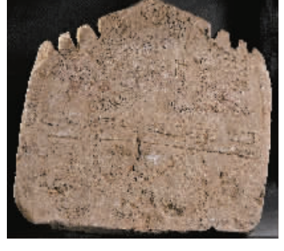
海南岛伊斯兰墓碑