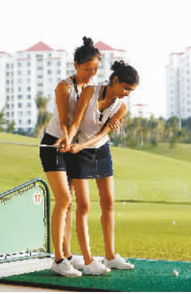
模特们在鲁能新城高尔夫球场练习打高尔夫球。

本报三亚10月26日电 (记者张旗星)在三亚湾的一块高尔夫球练习场上,一阵阵清爽美妙的笑声引来众多游人观看。在这个号称高雅运动的场地上,参加世界精英模特大赛总决赛的佳丽们虽然“洋相”百出,却向世人展示出不一样的可爱与美丽。