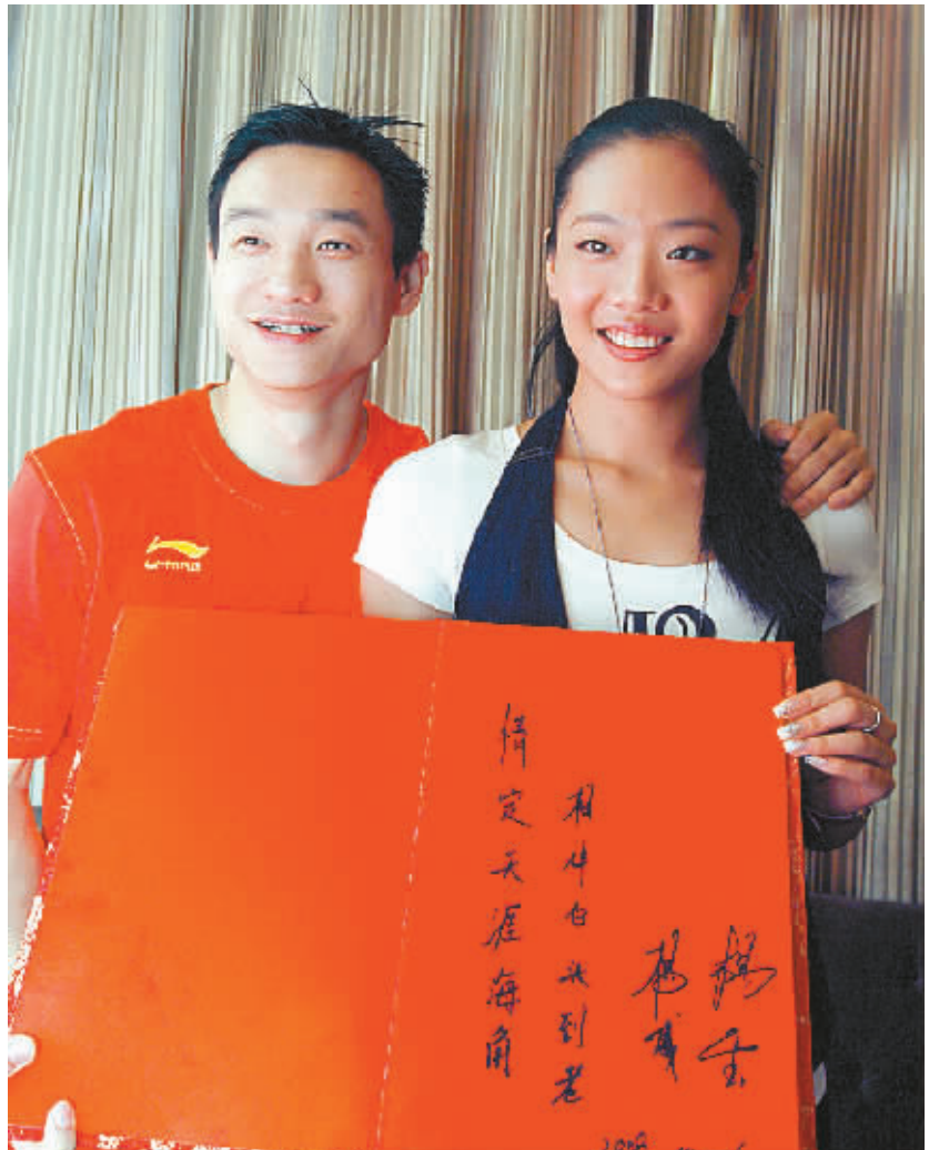
杨威、杨云展现“相约天涯海角 相伴白头偕老”的帖子。 本报记者 程范滢 摄

婚礼当天,天涯海角将不仅成就杨威、杨云的浪漫婚礼,还将成为中国体操界的“白头偕老”的帖子。 本报记者 程范滢 摄